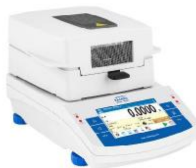
Рисунок 4 – Общий вид анализатора влажности с цветным сенсорным дисплеем 5" (X2)

Для защиты анализатора от несанкционированного доступа, который может привести к искажению результатов измерений, корпус анализатора пломбируется контрольной этикеткой изготовителя.