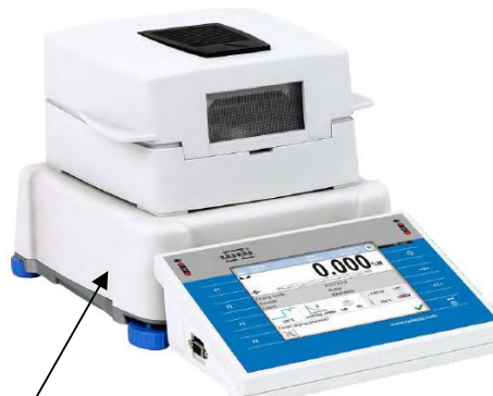
Место нанесения знака поверки