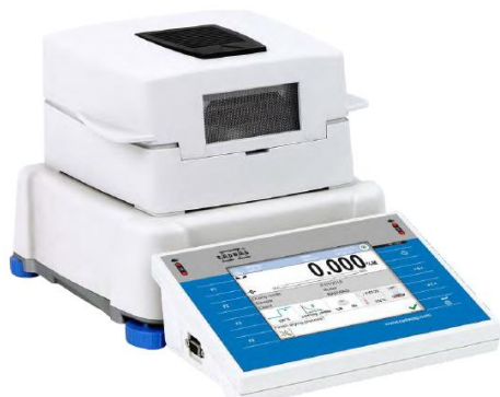
Рисунок 1 – Общий вид анализатора влажности с цветным сенсорным дисплеем 5,7" (3Y)

Общий вид анализаторов влажности представлен на рисунках 1, 2, 3, 4.