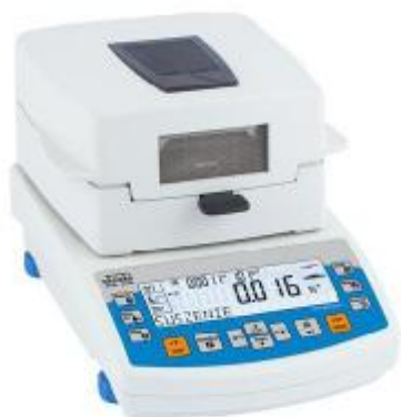
Рисунок 3 – Общий вид анализатора влажности со стандартным LCD дисплеем (R2)