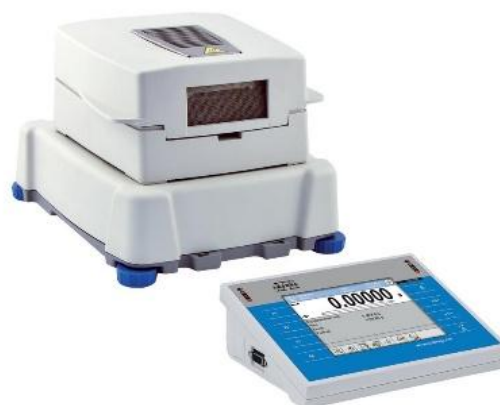
Рисунок 2 – Общий вид анализатора влажности с беспроводным дисплеем (3Y.B)