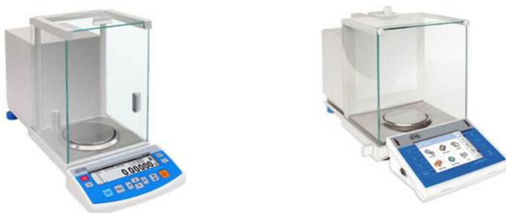
Рисунок 3 – Общий вид весов с графическим дисплеем и с сенсорным дисплеем.