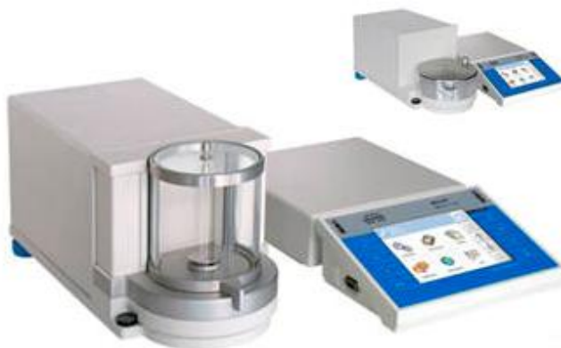
Рисунок 2 – Общий вид весов.